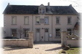
Mairie de Marc-la-Tour, siège de mairie déléguée

La municipalité est heureuse de vous accueillir à Lagarde-Marc-la-Tour. Ce livret vous présente notre commune et regroupe des informations utiles. Vous y découvrirez les nombreux services communaux, les commerces, les établissements scolaires, les associations. Chaque jour, les élus et le personnel municipal se mobilisent pour que chacun puisse trouver sa place et s'épanouir dans un cadre de vie que nous nous attachons à préserver et embellir.