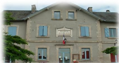
Mairie de Lagarde Enval, Chef- lieu de Lagarde-Marc-la-Tour